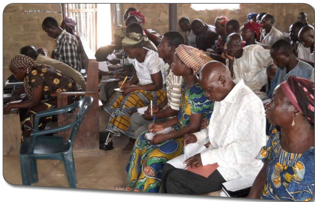
Evangelister i Kontagora på skolebænken