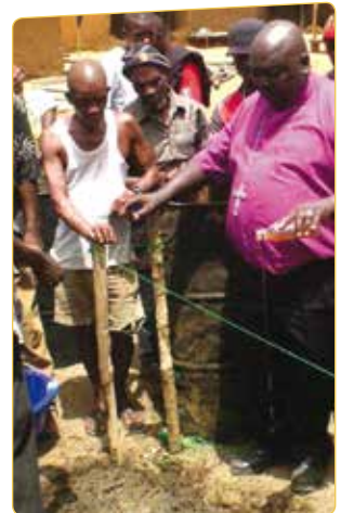
Kirken vokser! Her lægges grundstenen til en ny kirke i en sierra leons landsby.

præster, og Mission Afrika vil gerne bakke op. Derfor har Det Anglikanske Stift i Bo og Mission Afrika i fællesskab igangsat et uddannelsesprojekt, som vil styrke kirken gennem videreuddannelse af præster og uddannelse af lægfolk med særlige opgaver i kirken. Mission Afrika udsender et dansk præstepar til projektet, som sammen med lokale medarbejdere vil stå for at udarbejde og gennemføre projektet i tæt samarbejde med lokale menigheder.